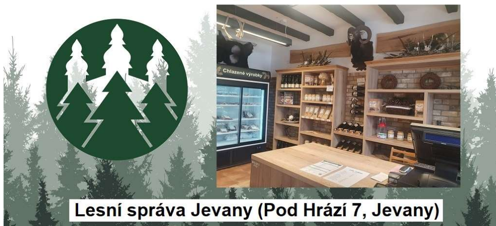
Lesní správa Jevany (Pod Hrází 7, Jevany)