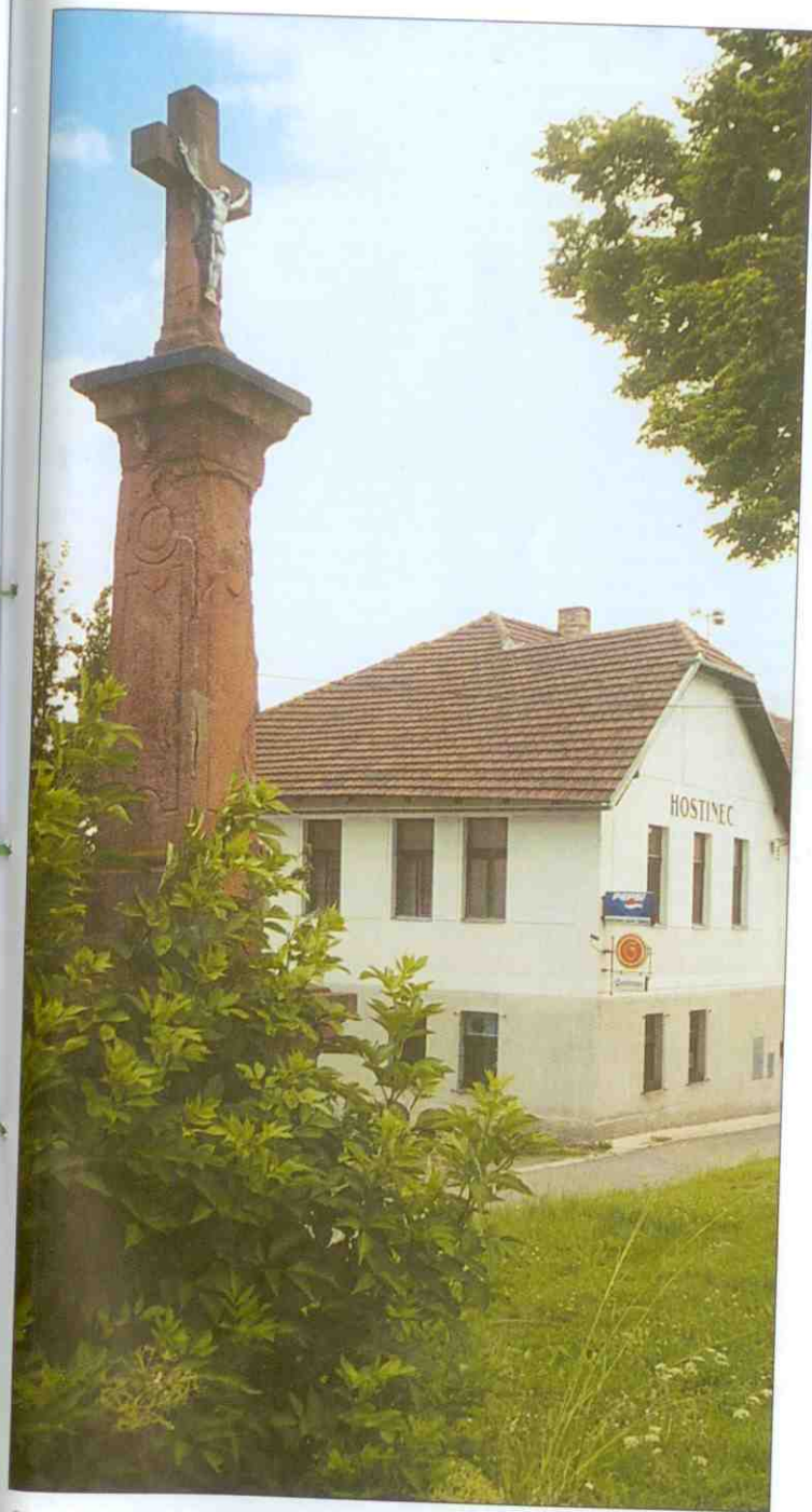
Hostinec v Hradových – tak se to tu stručně jmenuje a mýněno je v Hradových Strímelicích