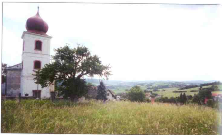
Od barokního kostelíka v Kostelních Střimelicích je překrásný výhled do údolí Jevanského potoka

zdroj obživy. Zachovala se o tom dokonce pověst, vyprávějící o dřevorubci, který se v lese sprátelil s jedním z čertů, žijících v okolních skalách. A ten ho u ohničku naučil zvláštní věci: hořící dřevo zaplácal jílem a nahoře nechal otvor, kterým odcházel dým. Když po pár dnech nedůvěřivý dřevorubec jílovou kopku rozkopal, našel ze dřeva už jen černé kousky. Ale jak do nich foukl vítr, rozhořely se a hrály silněji než nejlepší polena. Od té chvíle dřevorubec pověsil svoje řemeslo na hřebík, stal se uhlířem a začal stavět mlíře. Jeho potomci pak ve voděradských lesích pálili dřevěné uhlí ještě za císaře pána Franze Josefa.