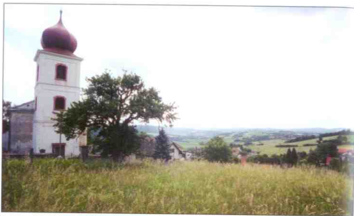
Od barokního kostelíka v Kostelních Střimelicích je překrásný výhled do údolí Jevanského potoka

zdroj obživy. Zachovala se o tom dokonce pověst, vyprávějící o dřevorubci, který se v lese sprátelil s jedním z čertů, žijících v okolních skalách. A ten ho u ohničku naučil zvláštní věci: hořící dřevo zaplácal jílem a nahoře nechal otvor, kterým odcházel dým. Když po pár dnech nedůvěřivý dřevorubec jílovou kopku rozkopal, našel ze dřeva už jen černé kousky. Ale jak do nich foukl vítr, rozhořely se a hrály silněji než nejlepší polena. Od té chvíle dřevorubec pověsil svoje řemeslo na hřebík, stal se uhlířem a začal stavět mlíře. Jeho potomci pak ve voděradských lesích pálili dřevěné uhlí ještě za císaře pána Franze Josefa.