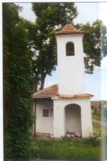
Kaplička v Hradových Strmilicích

rem na Jevany. Za podlouhlou zá- táčkou odbočíme vpravo na hráz Vyžlovského rybníka, za ní se na- pojíme na červenou značku (B) a jdeme po ní vpravo až do míst, kde se od ní odpojuje žlutá (C). Přestoupíme na ni, kousek po ní popojdeme a na křižovatce s modrou značkou (D) opět zmé- níme barvu. Po modré pokračuje- me vlevo, projdeme Voděrad- skými bučinami až k silnici při- cházející zleva od Jevan (E). Tady se napojíme na červenou značku a po ní pokračujeme až do Čer- ných Voděrů (F). I za nimi pokraču- jeme po červené až do míst, kde se setkává s modrou (G). Opět změníme barvu a po modré projdeme Kostelními Strmilicemi (H) do Hradových Strmilic (I). Tam, kde značka opouští obec, opustíme i my značku a dáme se vlevo po cestě ke skupince vzrost- lých lip. Hřebenovou cestou od- tud zamíříme ke Stříbrné Skalici. Zhruba po dvou kilometrech na- razíme na žlutou značku a s ní se- toupíme vlevo k městu (J). Odtud už po silnici projdeme k řece Sá- zavě (K). V blízkosti hospody Na Marjánce tu je stanice autobusu a za řekou stanice vlaku.