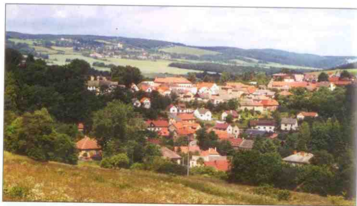
Stříbrné Skalici se pro její půvabné rozložení po svahu říkávalo Betlém

pravé svírá řeku Sázavu a levé Jevanský potok. Z cesty, která po hřebeni běží, se otevírají pohledy do všech stran. Po levé ruce vidíme nedohledné černokostelecké lesy, vpravo vrchy táhnoucí se k Blaníku, v dálce před námi se zdvihá Melechov a když se otočíme zpátky, rozeznáme na vrcholku Pecného budovy ondřejovské hvězdárny.